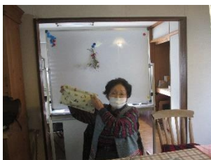
私も出来ましたー!