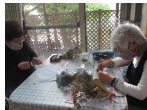
どんな形にしようかな