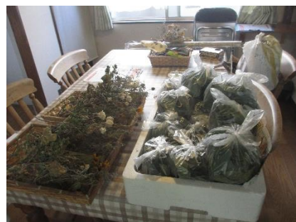
沢山のドライハーブをご用意いただきました

いい香り。今日からアルプスのハイジのように柔らかな香りに包まれて夢を見ることになりそうです。