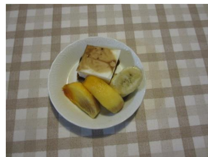
手作りの牛乳寒とフルーツ