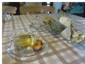
ハーブティーとクッキー

方々とふれあい、楽しい会話の時間が持てたらうれしいなあと思っています。手作りのお菓子も徐々に用意していきますので、郷里の茶菓子の作り方など、色々聞かせてください。どうぞよろしくお願いいたします。」(西嶋)