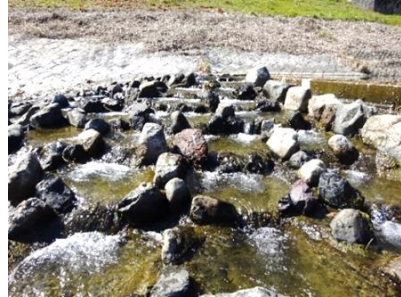
川原の石で作った魚みち

に石ころ1つ1つを全部手描きし、大阪府に対して施工手順も提案しました。すごいプレッシャーでしたが、上手くいった時の喜びも大きいです。仲間と飲む酒もうまい!!!