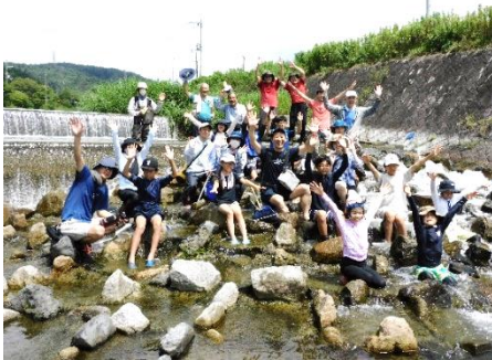
石の魚みちで“はいポーズ” (芥川たのしみ隊)